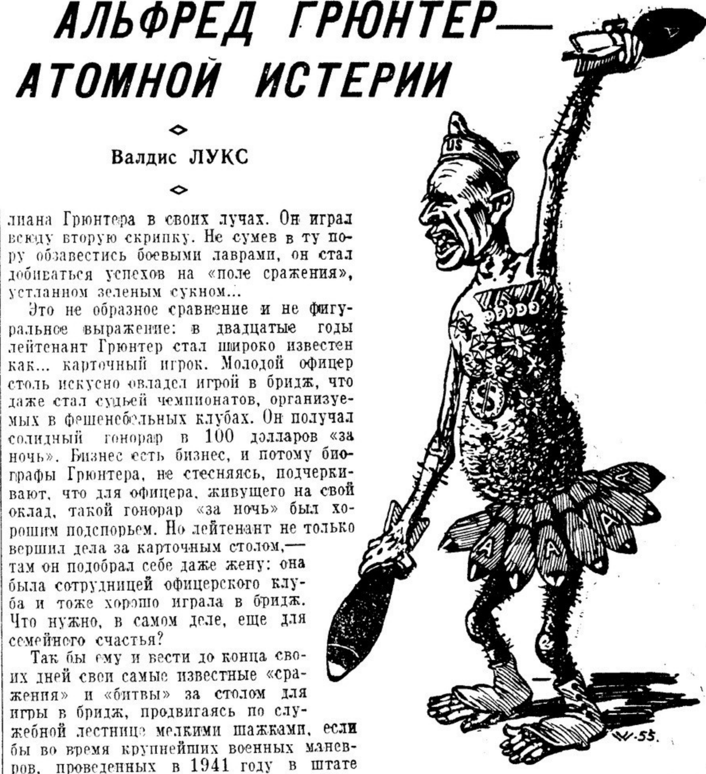
Рис. В. Валдманиса (Рига)